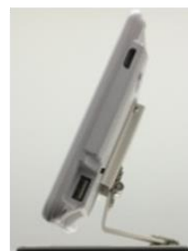
取付金具設置イメージ