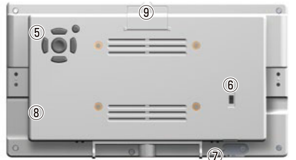
⑤ 操作ボタン (十字キー) ⑥ POWER (電源スイッチ) ⑦ DC IN (電源コネクタ) ⑧ USB2.0 接続端子 ⑨ SD メモリーカードスロット