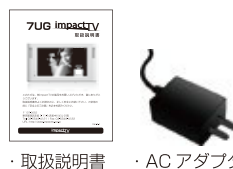
取扱説明書 ACアダプタ