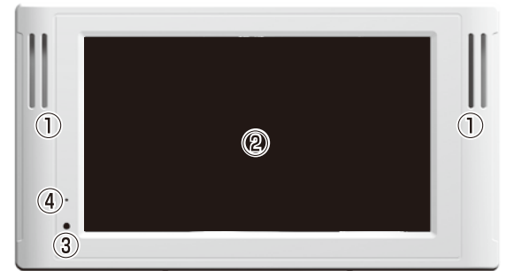
① スピーカー ② LCD ③ 赤外線リモコン受光部 ④ ステータスLED