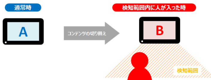
図)センサー反応イメージ図