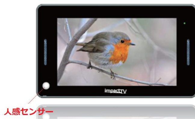
図) 7UZ- II impactTV

また、「7UZ- II impactTV」では端末とそれを見る人との距離によってコンテンツを切り替えることでより消費者の目を引くことも可能です。例えば、サイネージの近くに来た人に対して特別なコンテンツを再生することで来店サービス情報提供ツールとしての活用も可能になります。