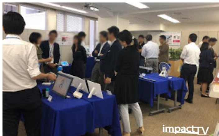
※写真は2019年7月東京本社 Private Show の様子

流通・サービス店舗に特化したアウトソーシング事業を展開するインパクトホールディングス株式会社(本社:東京都渋谷区、代表取締役社長 福井康夫、東証マザーズ・証券コード:6067)の子会社で、デジタルサイネージを中心とした店頭販促トータルソリューションの提供を行なっている株式会社 impactTV(本社:東京都渋谷区、代表取締役社長 川村雄二)は、大阪オフィスにて、Private Show を開催いたします。