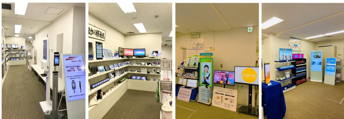
〈オープンスペース イメージ写真〉

当社が展開するデジタルサイネージの製品だけでなく、リアル店舗におけるフィールドマーケティングサービスをワンストップで提供するインパクトホールディングスのグループソリューションもご案内させていただきます。