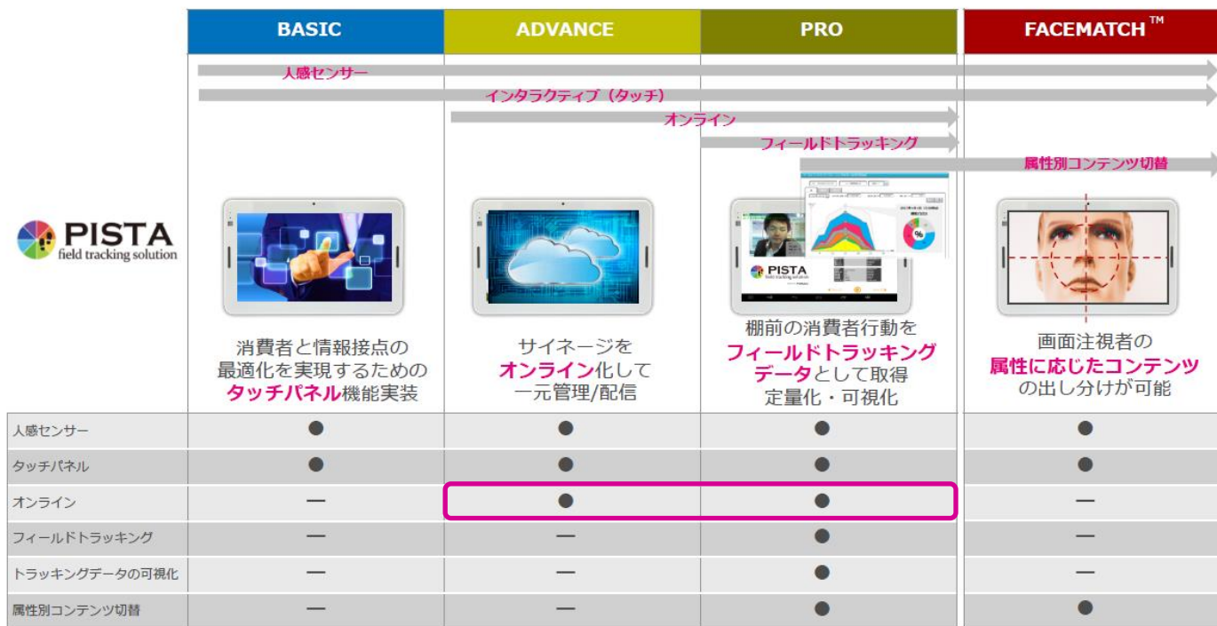
【PISTA ソリューション一覧】（図 1）

「PISTA」製品ページ： https://impacttv.co.jp/product/pista/