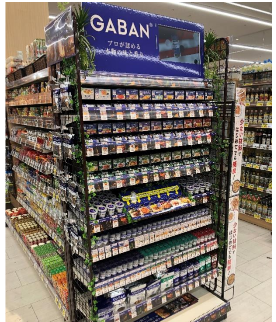
スパイス・エア・サイネージ 設置イメージ

※ 本ニュースリリース記載の情報(価格、仕様、サービスの内容、発売日、お問い合わせ先、URL 等)は、発表日現在の情報です。予告なしに変更され、発表日と情報が異なる可能性もありますので、予めご了承ください。