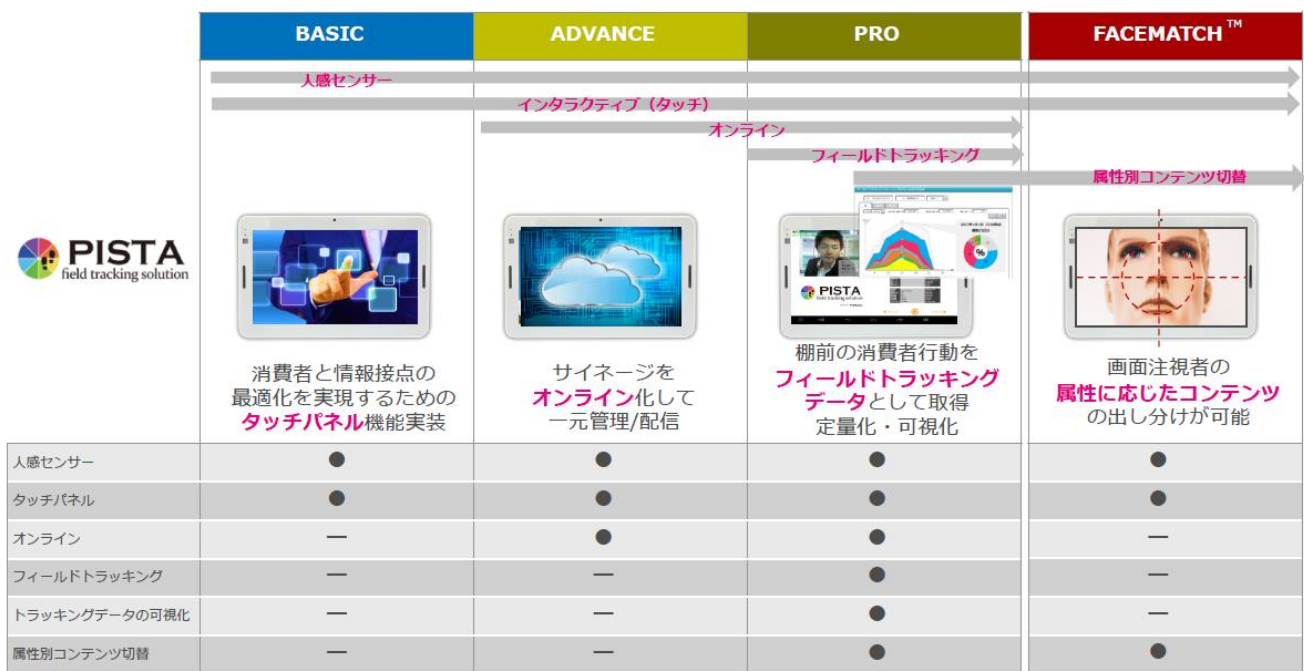
図 1 【PISTA ソリューション一覧】

「PISTA」製品ページ： https://impacttv.co.jp/product/pista/