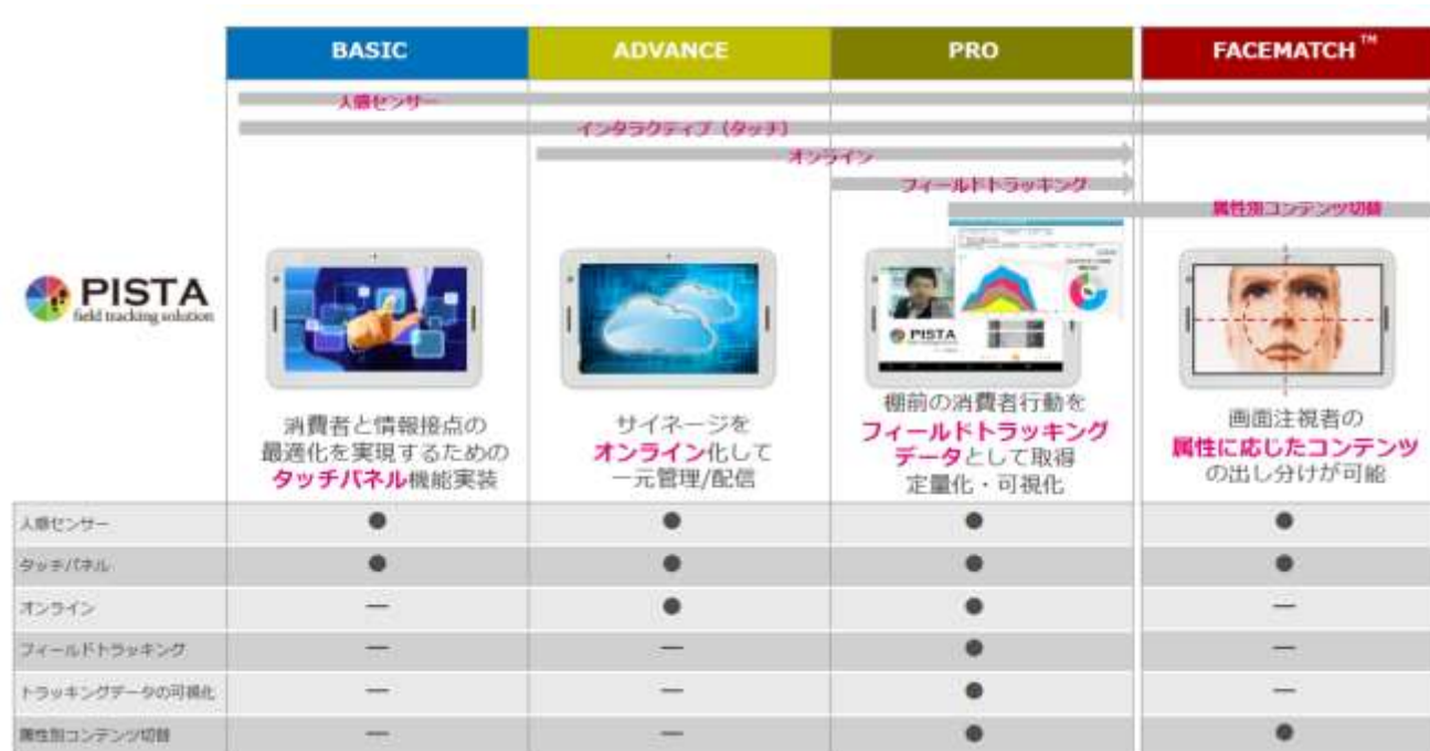
図1 【PISTA ソリューション一覧】

「PISTA」製品ページ： https://impacttv.co.jp/product/pista/